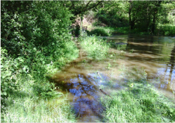
Passerelle inondée par la Doulaye

Depuis le mois de novembre, nous avons consacré beaucoup de temps et parcouru de nombreux kilomètres pour reconnaître les circuits, nous avons traversé de nombreuses propriétés privées.