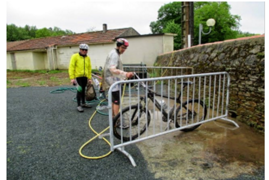
Les VTT ont nécessité un bon lavage