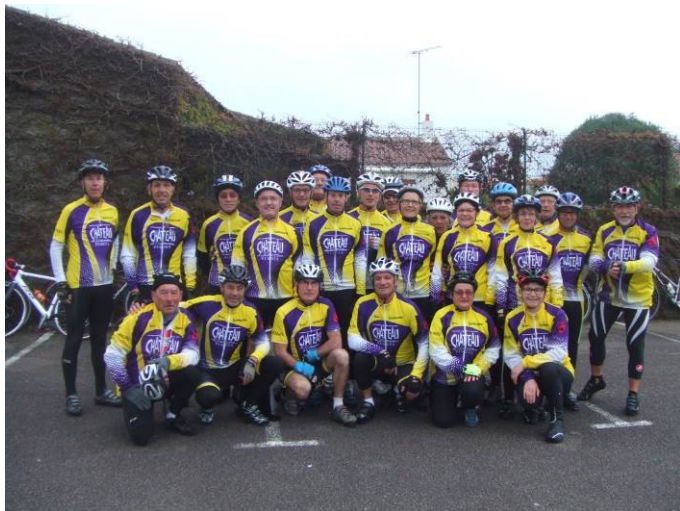
Photo des membres du club du Château d'Olonne équipés des nouvelles tenues

Notre club qui a été créé en 1988 compte cette année 55 licenciés dont 12 féminines.