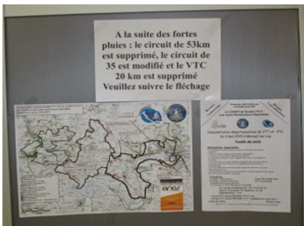
Affichage au départ des modifications de parcours

A la dernière minute, nous avons changé les points de ravitaillement de crainte des nouvelles pluies du dimanche.