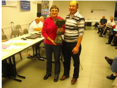
Le challenge remis à Mareuil