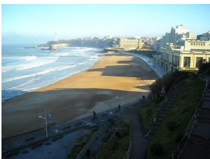
La plage de Biarritz