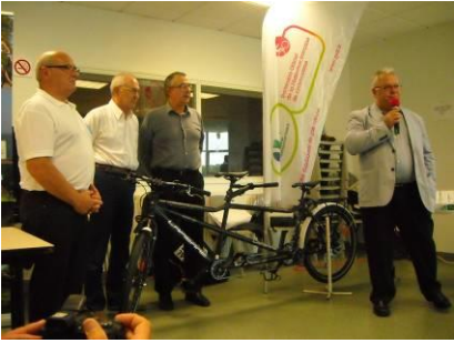
Le tandem offert par GRdf