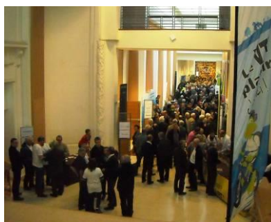
La foule des congressistes