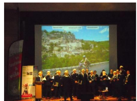
Un ensemble vocal basque pour clore l'assemblée