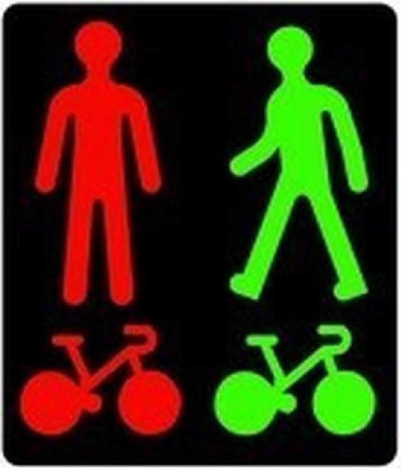
Illustration 2

Un feu mixte piéton-cycle pourra désormais être utilisé quand une piste cyclable est parallèle à un passage piéton au niveau de la traversée d'une voie. Actuellement expérimenté à Strasbourg, ce feu intègre un visuel de vélo rouge ou vert à l'instar du « bonhomme rouge » ou « bonhomme vert » pour indiquer aux cyclistes qu'ils doivent respecter le feu piéton. Il permet de clarifier les règles de traversées des cyclistes sur ce type voie.