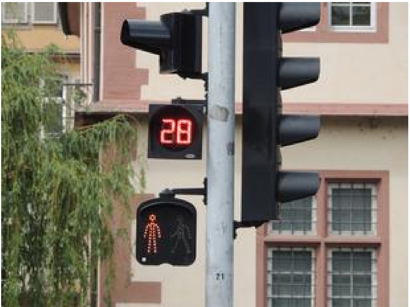
Illustration 3

Cette signalisation installée au niveau des passages piéton indique le temps d'attente avant de pouvoir traverser la chaussée (rouge piéton) et le temps qui vous reste pour effectuer la traversée du passage piéton (vert piéton). Expérimenté à Strasbourg, Vannes et Neuilly-sur-Seine, ce décompte du temps piéton a reçu un très bon accueil de la part des usagers qui, majoritairement, le jugent utile et sécurisant et considèrent qu'il améliore le confort de traversée. En outre, il inciterait une bonne partie des piétons à modifier leur comportement.